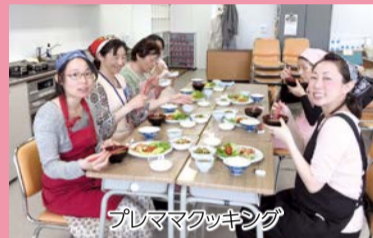
プレマクッキング