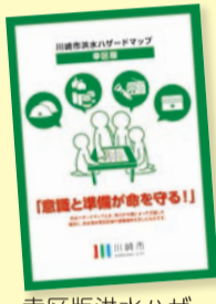
幸区版洪水ハザードマップを29年5月に改訂しました

防災・ハザードマップや災害への備えのための情報誌など、災害時に役立つ情報を区役所などで配布しています。区HPなどでも見られますのでチェックしてください。