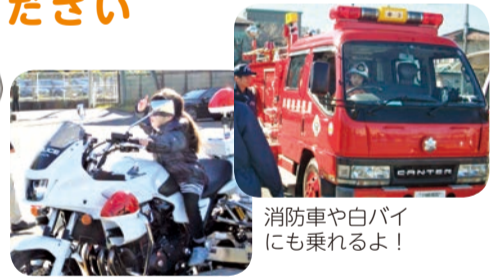
消防車や白バイにも乗れるよ!