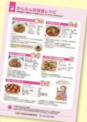
非常食をもっとおいしく、もっと身近に