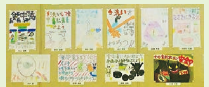
昨年のポスター展