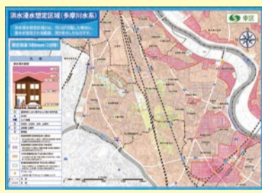
マップの他、非常持出品のリストなども掲載しています