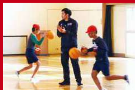
南加瀬小学校で開催したふれあいスポーツ教室

川崎ブレイブサンダースはバスケットボールを通じて地域とともに歩み、青少年育成や地域の活性化に貢献することを目指して活動しています。昨年度は区内の小学校で「ふれあいスポーツ教室」を開催したほか、地域のお祭りなどにも参加しました。今後も地域でのたくさんのイベントなどに出演する予定です。