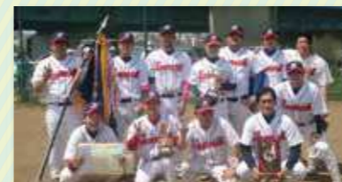
第46回町内会対抗 男子ソフトボール大会 優勝 河原町3号館自治会

区内では地域の人が集まって、さまざまな種類のスポーツを楽しんでいます。また、町内会・自治会や各種スポーツ団体などによりたくさんの人たちが参加する大会が開かれ、熱戦が繰り広げられています。