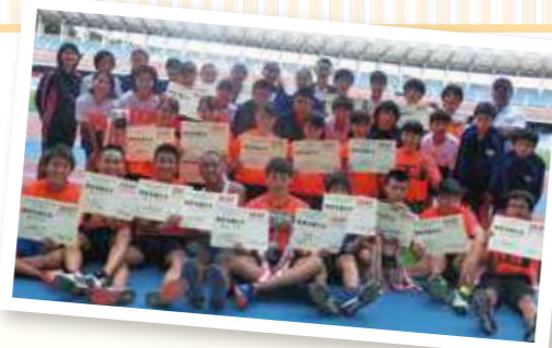
市中学校通信大会で総合優勝した 塚越中陸上部メンバー

部員たちは部活だけでなく勉強や学校生活にも積極的に取り組み、学級委員や体育祭の応援団長なども率先して務めているそうです。