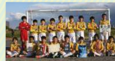
少年サッカー 幸区長杯争奪 第24回ハッピーリーグ高学年の部 優勝 東小倉SC