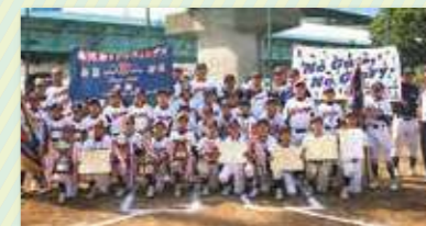
29年幸区少年野球連盟春季大会 優勝 南河原リトルウィングス