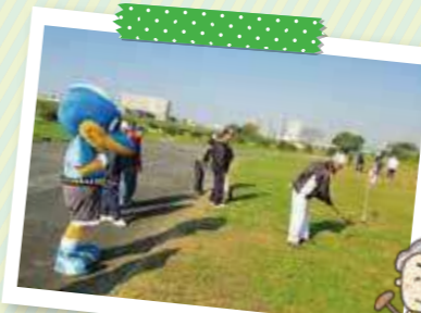
川崎フロンターレ 幸アシストクラブの協力で毎年 開催されている「幸フロンターレカップ」

ルールはとても簡単です。仲間同士で楽しくおしゃべりしながら、健康的にはつらつとプレーしてみませんか。