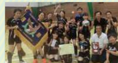
第46回町内会対抗 女子バレーボール大会 優勝 戸手本町2丁目町内会