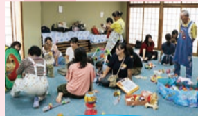
保育園の先生も来るので、保育園情報も聞けて参考になります

赤ちゃん相談会では、町内会・自治会などの地域の人たちが、赤ちゃんの身体測定や相談をメインとして、親子が自由にくつろいだりおしゃべりができるスペースを作っています。