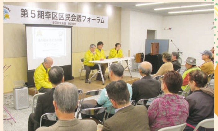
前回の提言発表の様子

時間 13時半～14時半 問 区役所企画課 ☎556-6612 FAX555-3130