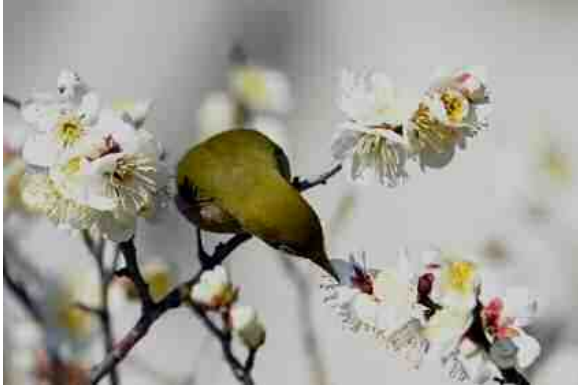
「梅蜜を啄む(2)」 平川 雅之 天満天神社(東古市場)