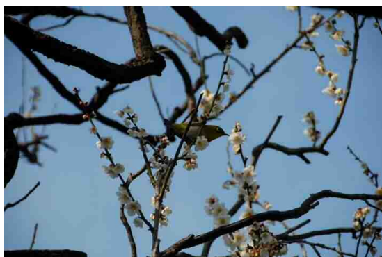
「早春のメジロⅠ」 岡 保夫 塚越2丁目