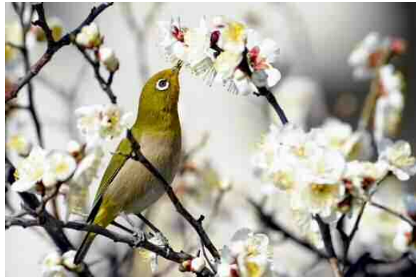
「梅蜜を啄む(3)」 平川 雅之 天満天神社(東古市場)