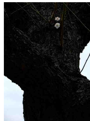
「二輪」 本間 稔 河原町団地