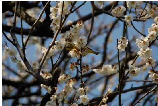
「早春のメジロⅡ」 岡 保夫 塚越2丁目