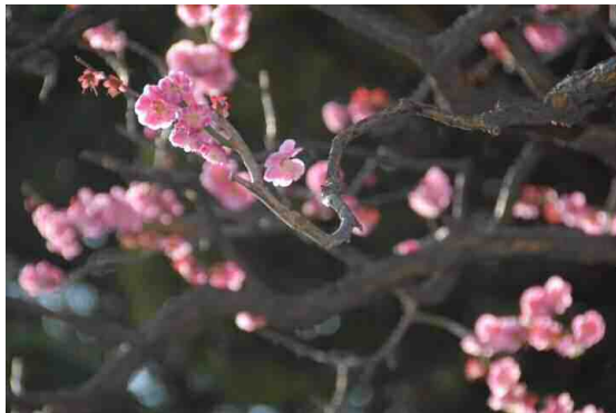
「春光の古木」 岡 保夫 塚越2丁目