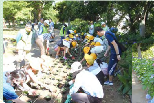
小学生との花植え

メンバー募集については、区役所地域振興課 ☎556-6606 FAX555-3130