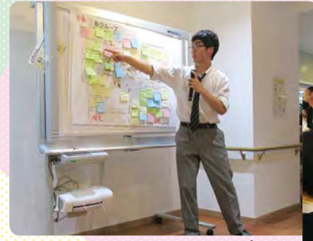
ゆめみらい交流会ワークショップの様子