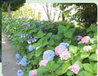
6月はアジサイが見頃