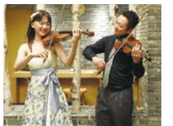
バイオリンの美しい音色をぜひお楽しみください

日時 11月21日(木)12時5分～12時45分 場所 日吉合同庁舎タウンホールやまぶき 出演 白いたぬき(バイオリンデュオ) 曲目 海に見える街、チャルダッシュ他 定員 当日先着80人 ※座席が限られていますので、立ち見の場合があります。