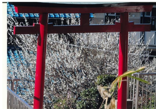
「鳥居と白梅」 成尾 脩平 夢見ヶ崎