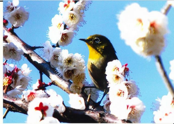
「梅とメジロ」 田島 一也 さいわいふるさと公園(新川崎)