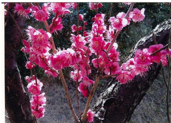
「紅梅」 成尾 脩平 ラゾーナ広場前