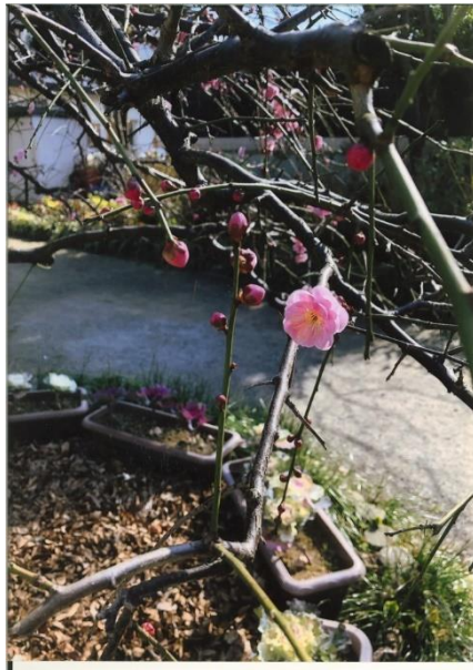
「ある日の愛しきもの」 入江 絵莉菜 さいわい緑道