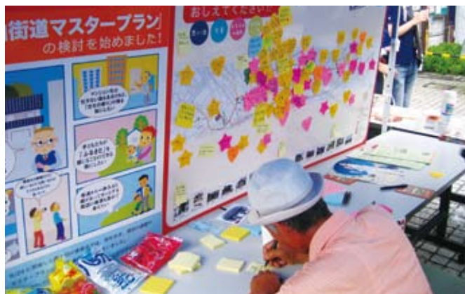
真剣なご意見を書いていただきました