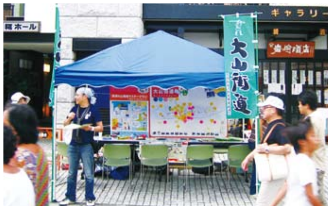
策定委員会ニュースなどを配布しました

また、参加者には、大山街道での思い出やおすすめの場所などを、カードに書いて地図に貼っていただきました。多くの大人や子どもたちの参加があり、80～90件程度のエピソードが集まりました。