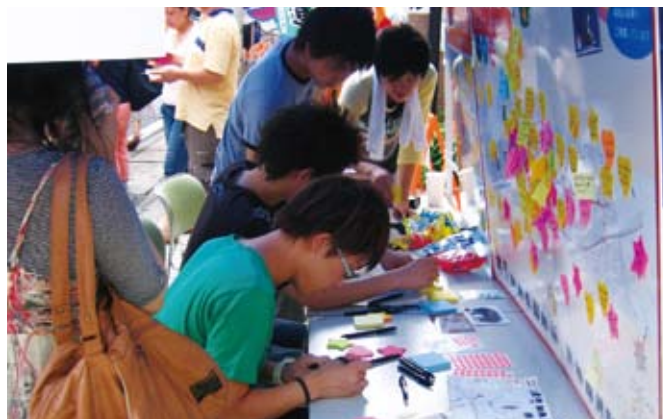
溝口緑地辺りの雰囲気が入ったとのこと