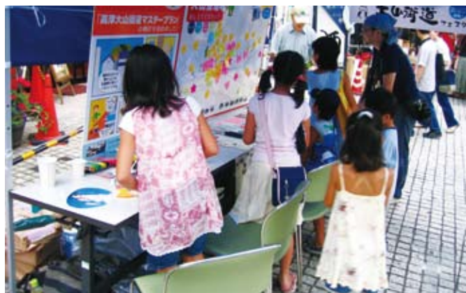
子どもたちもたくさんの意見を書いてくれました