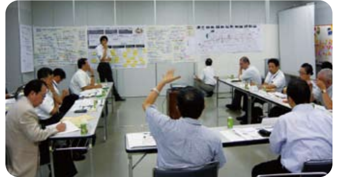
8月19日に、第2回「高津大山街道マスタープラン策定委員会」を開催しました。