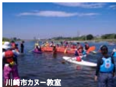
川崎市カヌー教室

今後は、明確な将来ビジョンの共有化、実効性のある施策体系の整備等とともに、それらを踏まえた市民と行政、企業等の協働による実践的な取組を地域から展開することによって、持続可能な循環型都市構造を創造・構築し、地球温暖化防止等に資する「エコシティたかつ」の創出を目指していく。