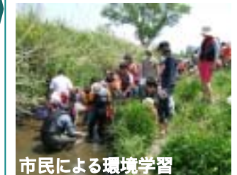
市民による環境学習

流域アプローチの展開や自然共生型の都市再生、農的空間を活かしたまちづくりなど、市民・企業・行政がそれぞれの役割と責任のもと、相互の立場を尊重し、対等な関係に立って協力する協働の手法を中心に