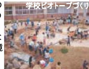
学校ビオトープづくり

ビオトープ、雨水利用施設の整備を学校、地元町内会、PTA、企業等との協働により進めるなど、事業展開にあたっては、協働による事業手法を中心に据えたものとする。またビオトープの整備等により、地域の生物多様性をより豊かなものにするとともに、環境学習の実践の場とする。