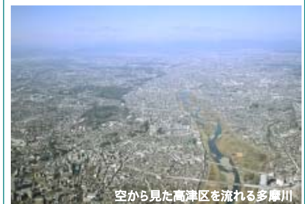
空から見た高津区を流れる多摩川

各種事業の推進によって、区民のエコ・マインド(環境を大切に作る心)を育み、エコ・コンシャス(環境志向の高い)なものにしていく。それにより、区民のライフスタイルの变革を促すとともに、地域の身近な水と緑の保全・創出・活用など、多様な環境資源を日常的に活かすことによって、豊かな市民生活の実現と新たな価値創造を目指す。