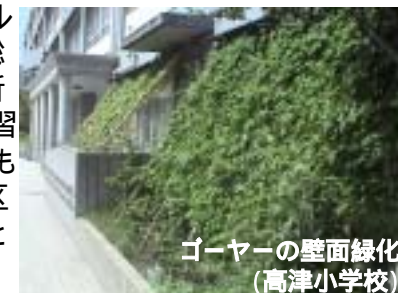
ゴーヤーの壁面緑化(高津小学校)

区役所を「エコシティホール」として、屋上緑化や壁面緑化などの各種環境技術や、省エネルギー機器導入や新エネルギーの導入などを総合的に進め、区役所来庁者への環境学習の一契機とするとともに、区役所として、区内のモデル事業者としての実践を示す。