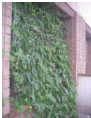
区役所の緑のカーテン