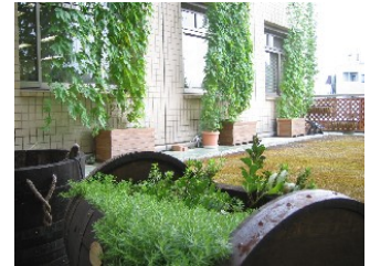
昨年実施した高津区役所庁舎 4階の緑のカーテンと屋上緑化

昨年に引き続き、今年も高津区「緑のカーテン」講習会を実施します。講習会の参加者には、ゴーヤーの種、作り方パンフレット、エコバックを差し上げます。いっしょに「緑のカーテン」をつくって、涼しい夏をおくりませんか。