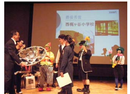
昨年の「緑のカーテン」コンテスト 表彰式(高津市民館)

応募方法 裏面の申込用紙をご記入の上、4月15日(消印有効)までに直接か FAX または 郵送で〒213-8570高津区役所企画課まで。※郵便番号のみが届きます。 各講習会の定員は50名です。応募者多数の場合は抽選となります