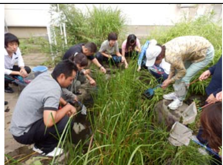
ビオトープでの生き物採取