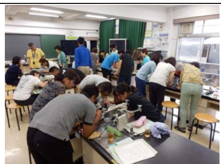
採取した生き物観察②