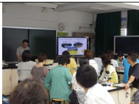
環境学習事例紹介