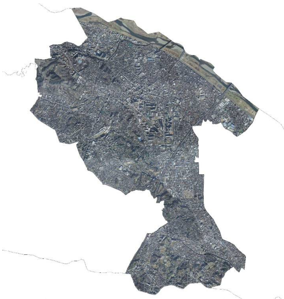
高津区航空写真(2003年)