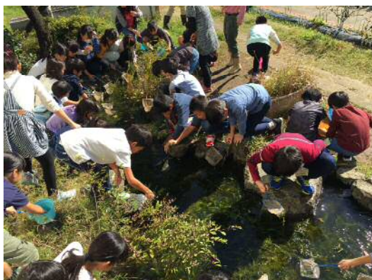
ビオトープから生きものを採取 (学校流域プロジェクト)