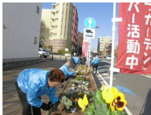
区民ミニガーデンによる花壇の整備