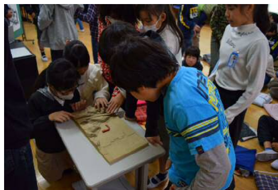
学校敷地周辺立体地形図に触れる子どもたち (小学校敷地丸ごと3D化プロジェクト)