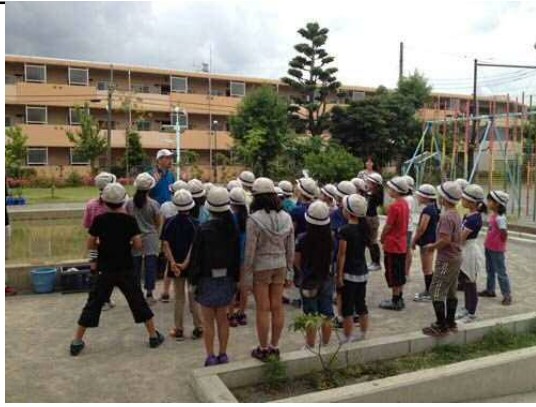
ビオトープの解説