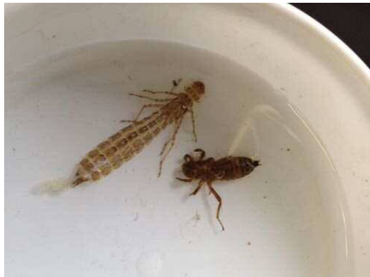
ギンヤンマ(脱け殻)とシオカラトンボのヤゴ