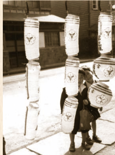
大山街道の提灯屋の前で(昭和30年頃)