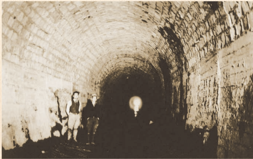
津田山隧道(平瀬川トンネル)(昭和15年頃)