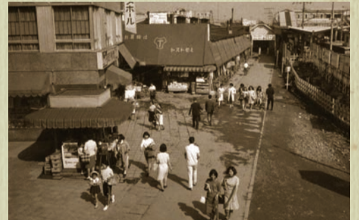
東急溝口駅から武蔵溝ノ口駅方向を眺める(昭和43年)

古写真に写っている場所を参加者同士で話し合いながら特定していく謎解きゲームや、溝口周辺のまち歩きを予定しています。懐かしい高津、まだ知らない高津に出会いに来ませんか。