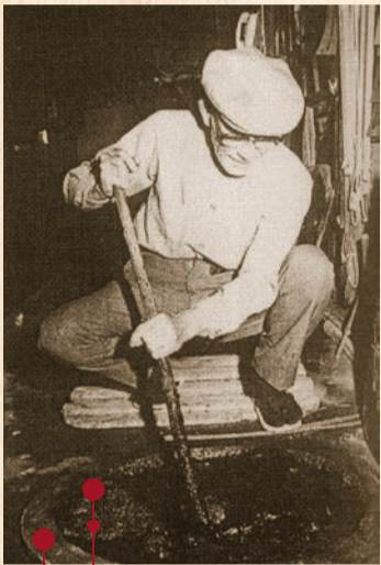
千年の紺屋 (昭和30年代)

地域に古くから住む人へのインタビューによる聞き取りとその記録を進めています。郷土史には記録されていない、地域の人々の日常生活や、まちの移り変わりを知ることができます。まちのこぼれ話をまとめた冊子は区役所や高津図書館、HPなどで閲覧できます。