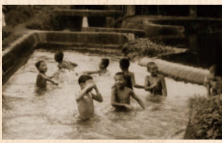
円筒分水で泳ぐ子どもたち(昭和43年)

区では町並みや暮らしを記録した写真を収集しています。古い写真をお持ちの方は、ぜひご連絡ください。