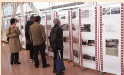
11月に実施した写真展の様子