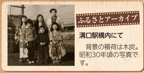
ふるさとアーカイブ 溝口駅構内にて 背景の積荷は木炭。 昭和30年頃の写真です。