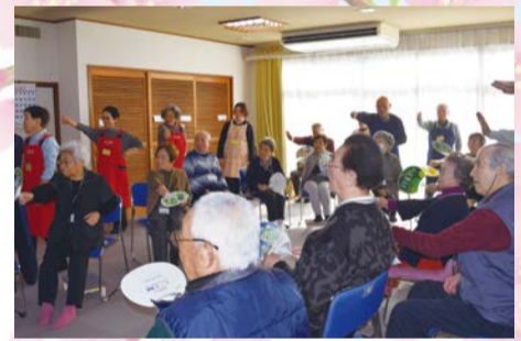
上作延ミニデイで、利用者さんたちとテントラちゃん体操をする民生委員児童委員

いこいの家に高齢者が集まり、みんなで体操をしたり、歌を歌ったり、お昼ご飯を食べたりします。季節を感じる催し物を行う他、お誕生日会なども行っています。場所によっては送迎サービスもあります。