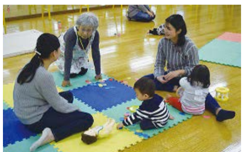
子育てサロンきらりりで、育児相談に乗る民生委員児童委員

子育て中の保護者を対象に、地域での仲間作りの場を提供し、充実した子育てを支援する子育てサロン。必要に応じて親に声を掛け、自身の経験を生かして、悩める保護者の相談役になります。