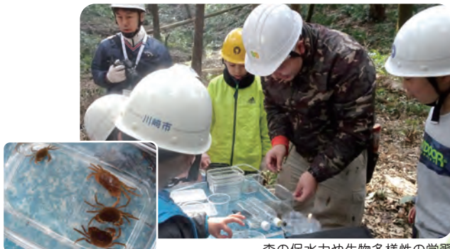
森の保水力や生物多様性の学習