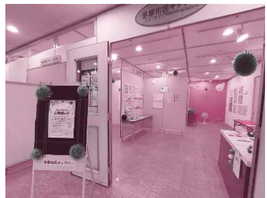
(昨年度の開催の様子)

※コロナ禍の活動状況のため、広報紙の展示を見送っているPTAもございます。多摩区全校の展示ではありません。ご了承ください。