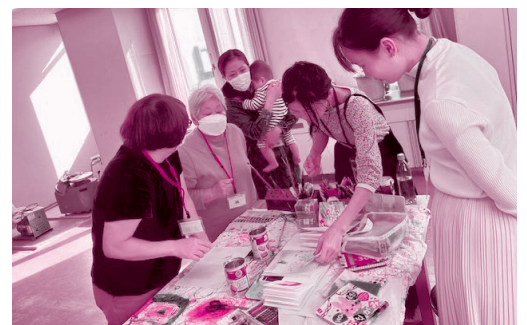
様々な画材の特徴を学び、実際に試してみました。