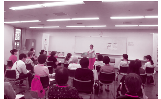
「絵本の世界観を表現するヒント」、 「伝わる文章のコツ」の学びを経て、 絵本づくりワークに取りかかりました。

2024年、川崎市は市制100周年。この記念の年には、市民へアプローチする様々な記念事業が展開される予定です。 その中の一つのテーマに「絵本」が掲げられています。 多摩市民館では、プレ事業として「はじめての絵本づくり応援講座」を開催しました。(令和5年10月5日(木)～11月30日(木)全6回) 絵本に造詣が深い講師陣の指導の下、受講者同士交流し合いながら世界に一つの個性豊かな22冊の絵本が誕生しました。 これらの手づくり絵本を、多摩図書館内の特集コーナーに展示いたします。図書館にお越しの際は、ぜひ手に取ってご覧ください。