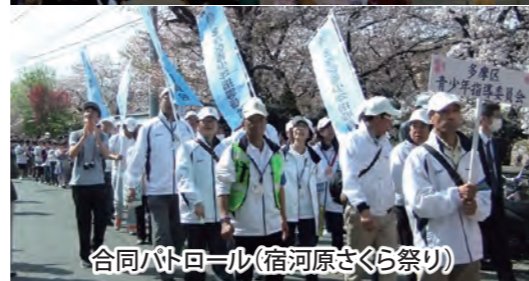
合同パトロール(宿河原さくら祭り)