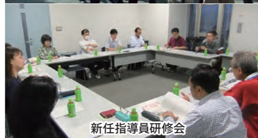
新任指導員研修会