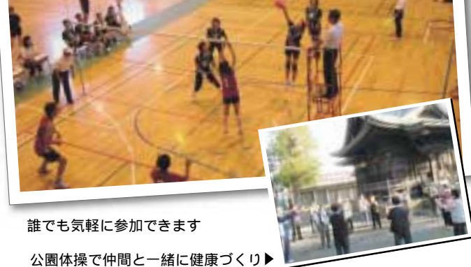
誰でも気軽に参加できます