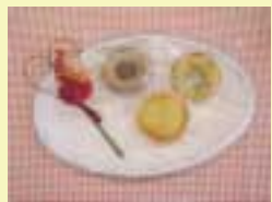
昨年度作った焼きドーナツと洋なしのタルト

囲 9月15日から電話かファクス(住所、氏名、人数、連絡先を記入)で、読売ランド前駅周辺まちづくりプロジェクト(高橋) ☎090-6501-7370、☎965-0737。[先着順]