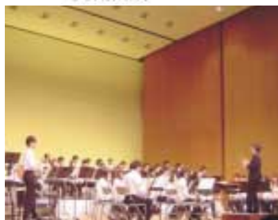
素晴らしい音楽を届けます