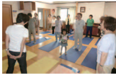
自分のペースで体操を楽しめます

区内21カ所の町会・自治会館・いこいの家・集会所などの屋内で行われています。全身をストレッチする体操です。