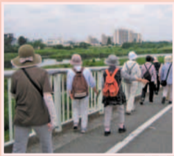
楽しみながらウォーキング