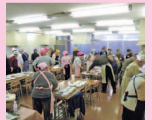
楽しく料理を学べます

囲圍12月18日から電話で区役所地域保健福祉課☎935-3117、FAX935-3276。[先着順]