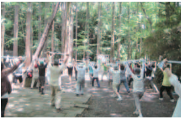
手拭いも使い楽しく運動します

区内30カ所の公園や神社などの屋外で行われています。ストレッチなどが中心のゆったりとした体操です。