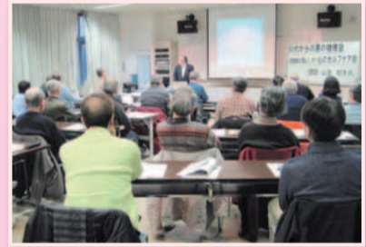
明日からできる実技を学べます

対象 おおむね60～70歳代前半の人 ※2日目はエプロン・三角巾・布巾・タオル持参。材料費は実費。3日目は動きやすい服装で、飲み物・タオル・雨具持参。 囲圍12月16日から直接か電話で区役所地域保健福祉課☎935-3294、FAX935-3276。[先着順]