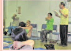
各種体操を学べます