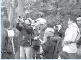
四季折々の動植物を観察します

日曜の10時～12時に、テーマごとの「生田緑地観察会」を開催しています。1月18日「野鳥」、25日「地層」、2月1日「植物」、8日「シダ植物」、15日「野鳥」。当日9時50分までにD51(蒸気機関車)前にお集まりください。雨天中止(かわさき宙と緑の科学館のホームページでお知らせします)