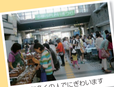
毎年多くの人でにぎわいます

多摩市民館 ☎935-3333、FAX935-3398。多摩区社会福祉協議会 ☎935-5500、FAX911-8119