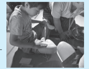
ずりだし体験をしてみよう