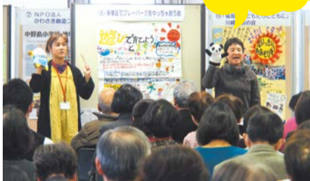
熱気溢れるポスターセッション