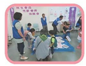
多摩ふれあいまつり