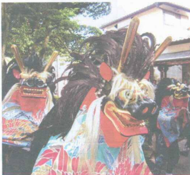
多摩区内の秋祭り予定

そこで「くらし委員会」では、まずは身近なところからスタート！を合言葉に、地域の様々な情報を発信してまいります。例えば、お住まいの近くのお祭り、商店会や町会のイベント、サークル活動など、気軽に催しを見に行く、顔を出してみる。タイミングが合えば参加させてもらう。ちょっとした機会を足がかりに新しい人の輪や交流が生まれるかもしれません。また、多摩区内に数多い文化財や史跡などもご紹介しつつ、安全確認や支援の連携など考察しながらお知らせしていきます。どうぞお楽しみに。