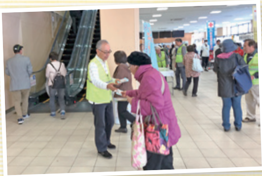
こんにちは、民生委員児童委員です

地域の皆様に民生委員児童委員の活動を知っていただけるようPR活動も行っています。