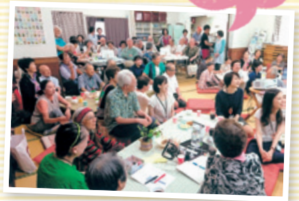
人と人をつなぐ地域のカフェ