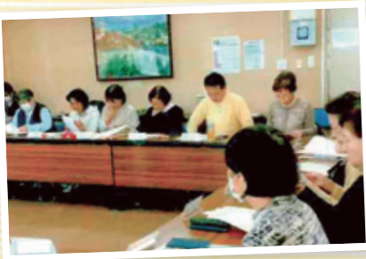
地区民児協の会議・研修