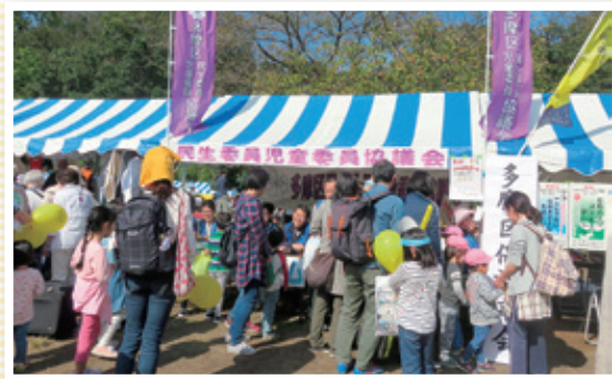
区民祭等でのPR活動