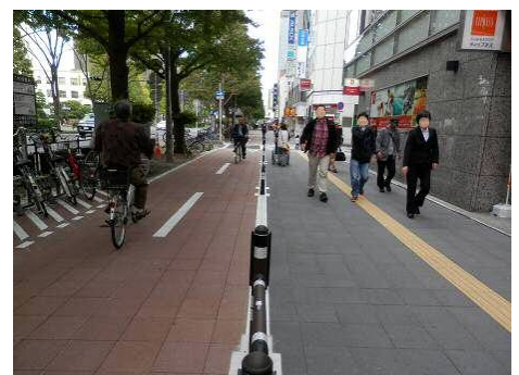
歩行者と自転車を分離/時間利用駐輪場整備