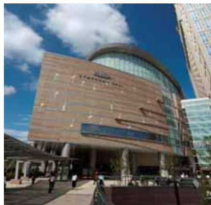
ミュウザ川崎シンフォニーホール