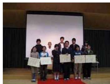
みやまえ映像コンクール表彰式