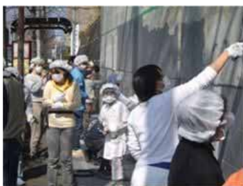
落書き消し作業の様子

中学生が地域を知り、親しむ機会を確保するとともに、「映像のまち かわさき」を推進するために、「みやまえ映像コンクール」を実施しました。