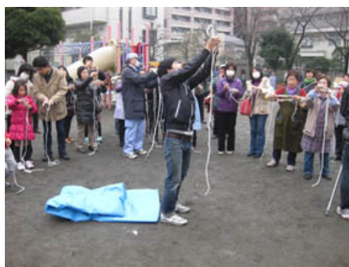
高津区で開催された「親子防災教室」