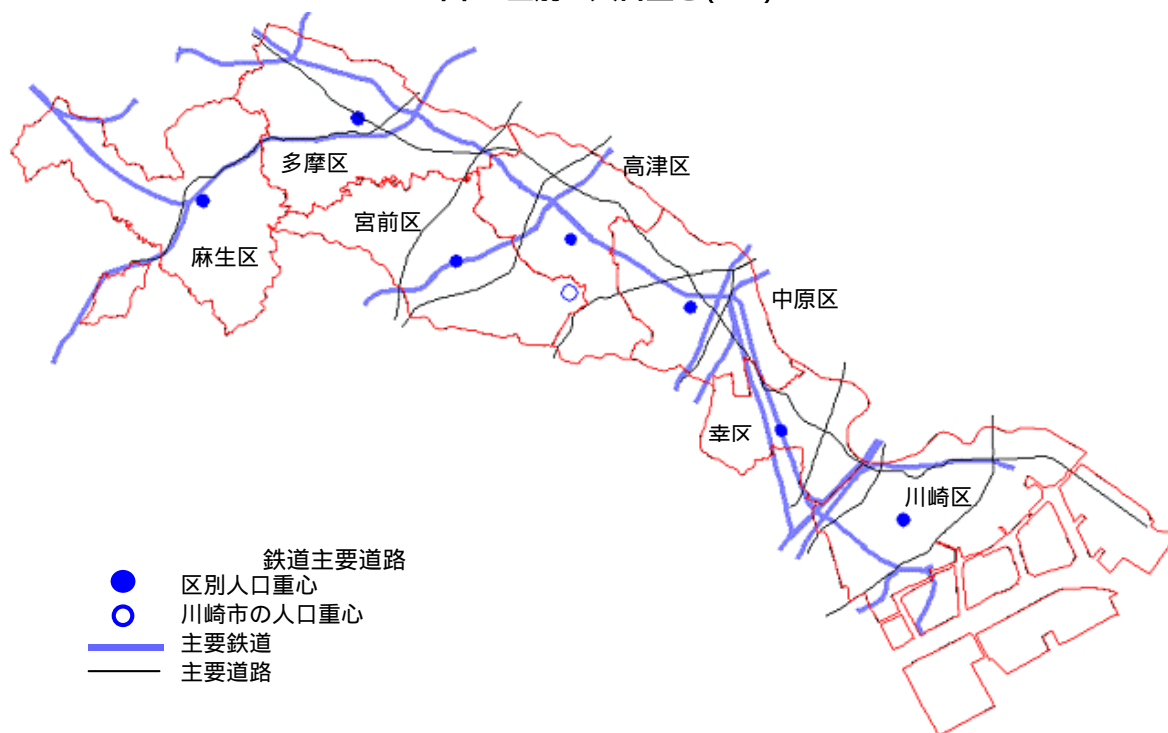
図2 区別の人口重心(H17)