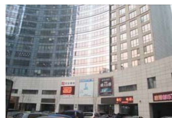
瀋陽オフィススペース入居ビル