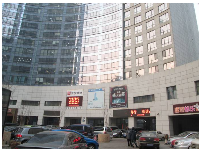
瀋陽オフィススペース （瀋陽市外国企業服務總公司） 入居ビル