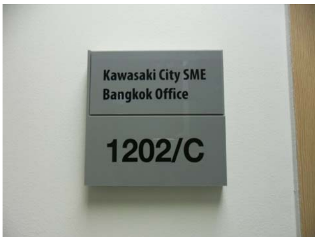
「川崎中小企業バンク合同事務所」看板