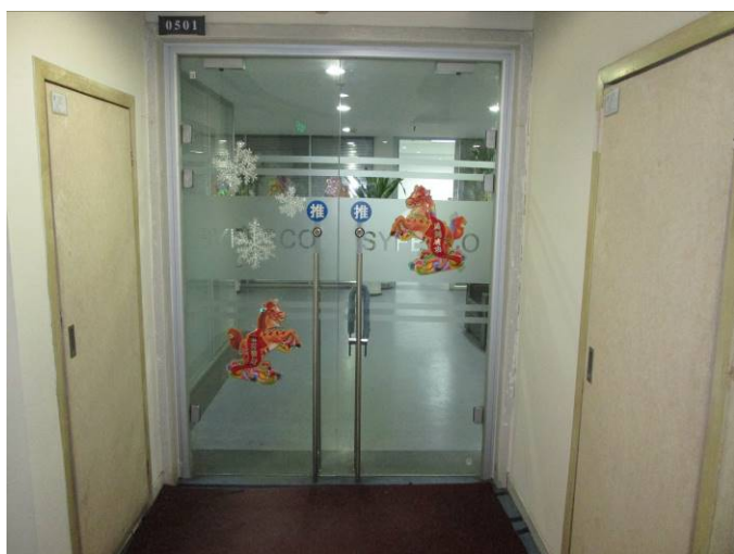
瀋陽オフィススペース 入り口