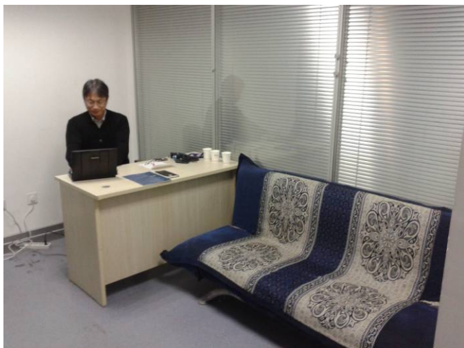
瀋陽オフィススペース