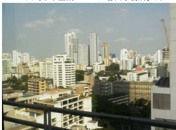
「川崎中小企業バンク合同事務所」からの眺め