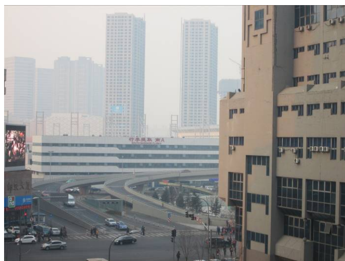
瀋陽オフィススペースからの眺め（瀋陽北駅）