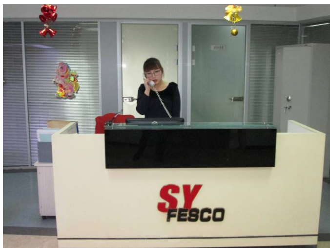
瀋陽オフィススペース （瀋陽市外国企業服務總公司） 受付