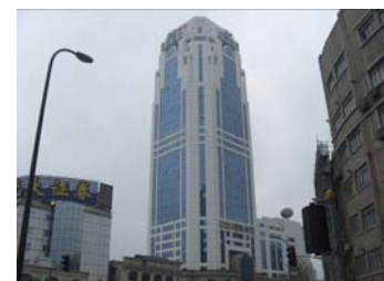
上海拠点入居ビル

川崎市経済労働局国際経済推進室 電話：044-200-2336 (内線 28321)