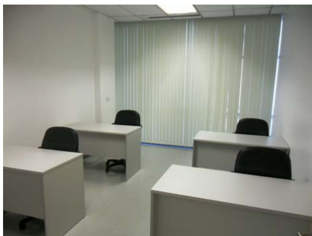
「川崎中小企業バンク合同事務所」内