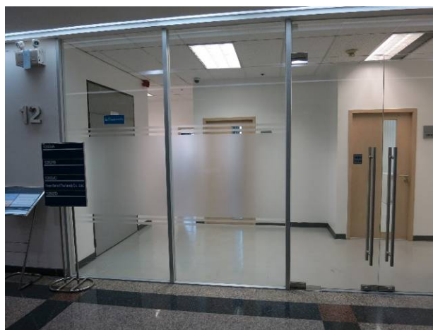
「川崎中小企業バンク合同事務所」入口