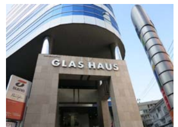
バンコク拠点入居ビル