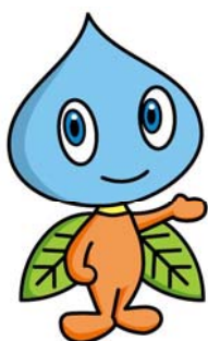
水道キャラクター ウォーターマン

モンドセレクション金賞の受賞を機に、「生田の天然水 恵水」をより一層PRしてまいります。