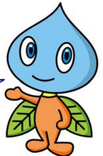
水道キャラクター ウォーター

※ 平成25年7月9日付けで、イオン株式会社と締結した 「包括連携協定」に基づいて実施するものです。