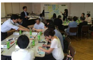
①各自のアイデアを付箋に記入