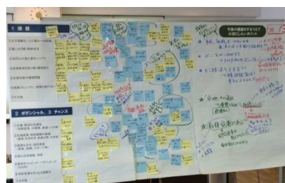
グループのまとめ

→ 次回からは部会に分かれて、分野を特定し、テーマを絞って、具体的な話し合いを進めていきます。