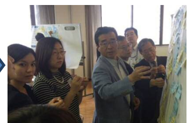
③共感できる意見に投票