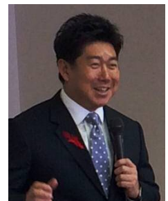
福田市長からのあいさつ