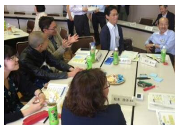
②みんなのアイデアを共有化