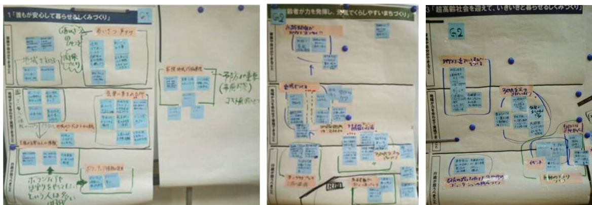
グループのまとめ

→ 本部会の成果は、第2回全体会に報告し、市民検討会議全体で共有し、話し合いに反映させます。