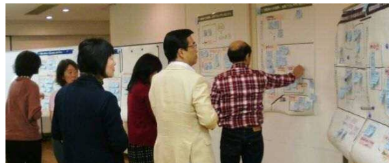
グループ発表後のシール投票