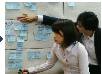
③意見を模造紙にまとめていきます