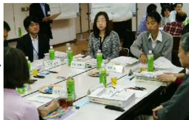
②みんなで意見を出し合います