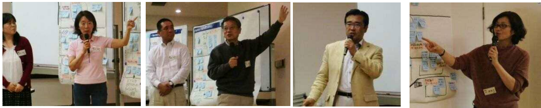
グループの代表者による発表