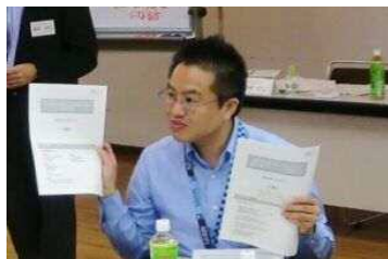
①市の職員から市の状況について説明