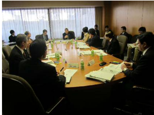
委員と市長による意見交換の様子