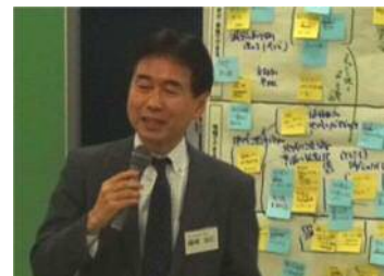
磯崎コーディネーターのまとめ

…情報を発信していても、届かなければ意味がない。また、ネット社会だからこそ、日頃の人間関係が重要であり、オフラインでもきちんと情報が届く仕組みが重要である。