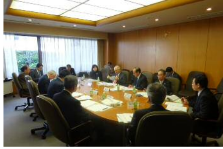
委員と市長による意見交換の様子