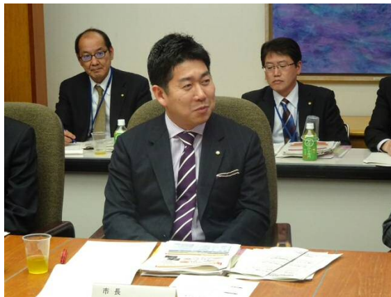
委員と市長による意見交換の様子