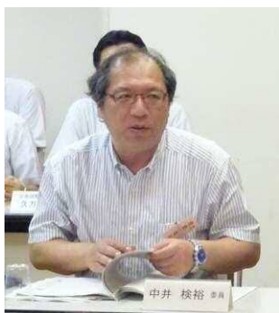
有識者会議委員と市民検討会議委員による意見交換の様子