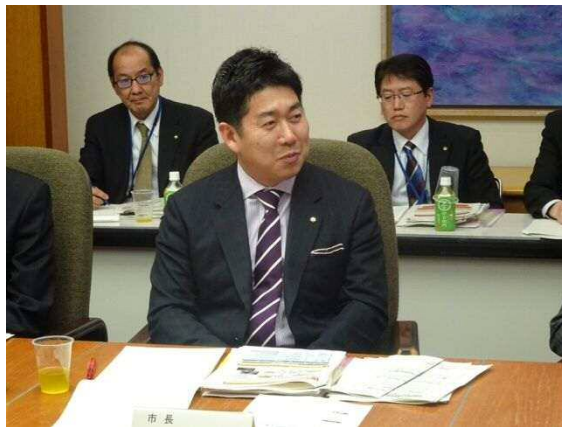
委員と市長による意見交換の様子