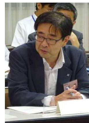
有識者会議委員と市民検討会議委員による意見交換の様子