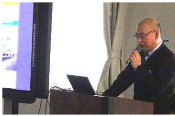
①市の職員から市の状況について説明