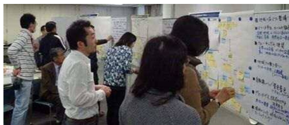
グループ発表後のシール投票