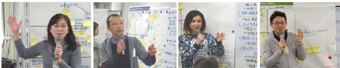
グループによる発表