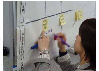
③意見を模造紙にまとめていきます