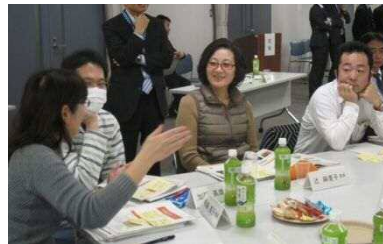
②みんなで意見を出し合います