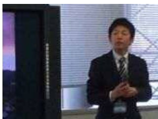
①市の職員から市の状況について説明