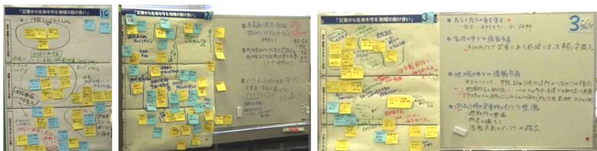
各グループのまとめ

→ 本全体会の成果は、有識者会議に報告し、有識者会議での話し合いに反映させます。