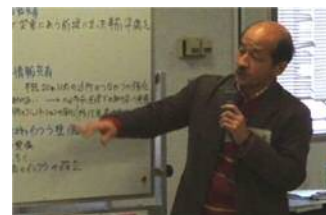
グループの代表者による発表