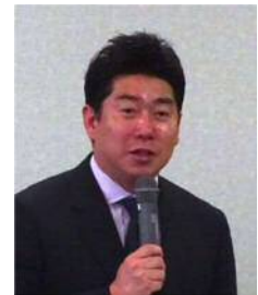
福岡市長からのあいさつ