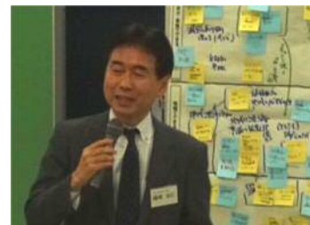
磯崎コーディネーターのまとめ

…情報を発信していても、届かなければ意味がない。また、ネット社会だからこそ、日頃の人間関係が重要であり、オフラインでもきちんと情報が届く仕組みが重要である。