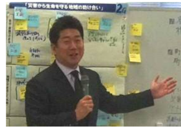
福田市長からのコメント