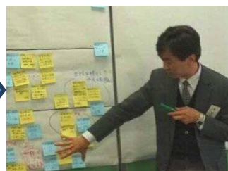
③意見を模造紙にまとめていきます