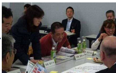
②みんなで意見を出し合います